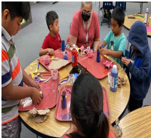
51 estudiantes participaron en el programa de verano de KG-5 grado