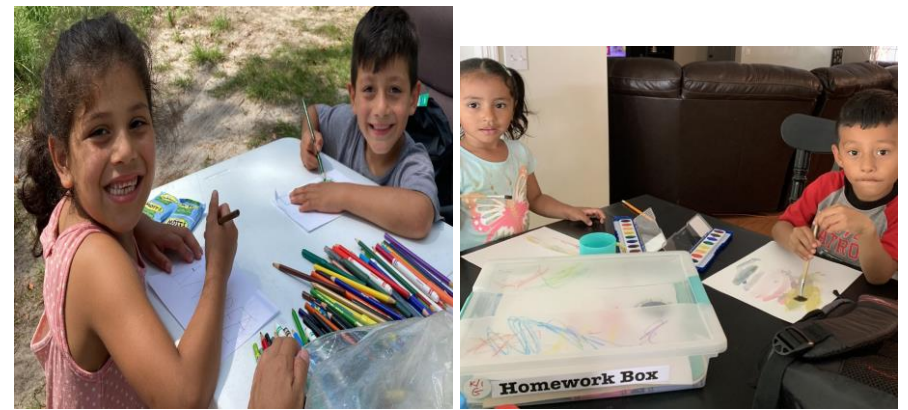
Volvimos a las tutorías en persona después de COVID