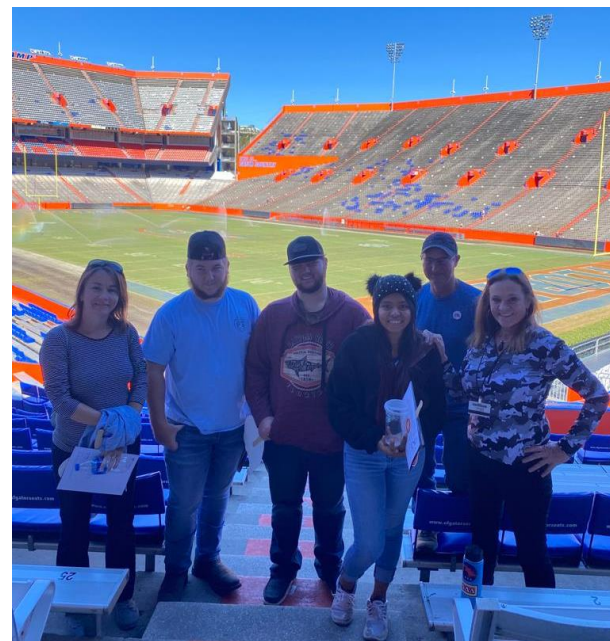
Estudiantes de Secundaria en un tour de la Universidad de la Florida

Estamos orgullosos de decir que 11 estudiantes se graduaron con un diploma de escuela secundaria y 1 estudiante recibió un certificado de finalización. Esto representa el 86% de los estudiantes del grado 12. Además, 4 estudiantes recibieron el sello de biliteracy en sus diplomas ya que pasaron el examen de español que lo otorga.