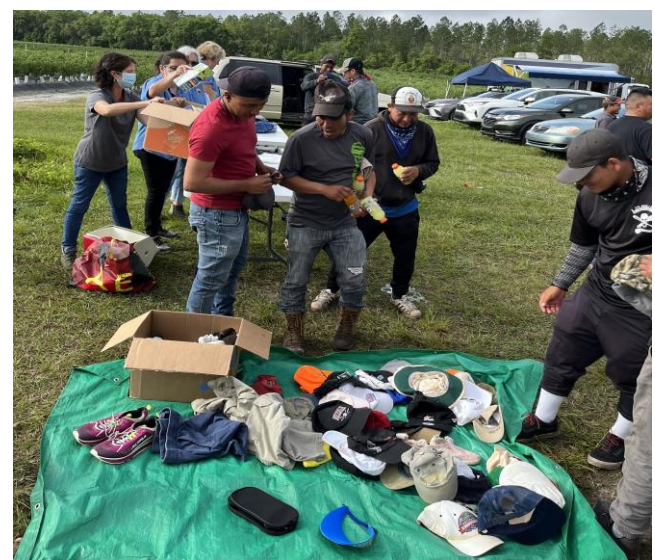
Jóvenes trabajadores en una feria de salud, recibiendo donaciones

2021-22 continuó siendo un año con muchos desafíos para brindar servicios a esta población. Nuestro programa proporcionó guías de lecciones de inglés, referencias a clínicas y servicios de salud, así como ferias de salud, y donaciones de ropa, zapatos, medicinas y otros artículos, gracias a la colaboración de entidades en la comunidad.