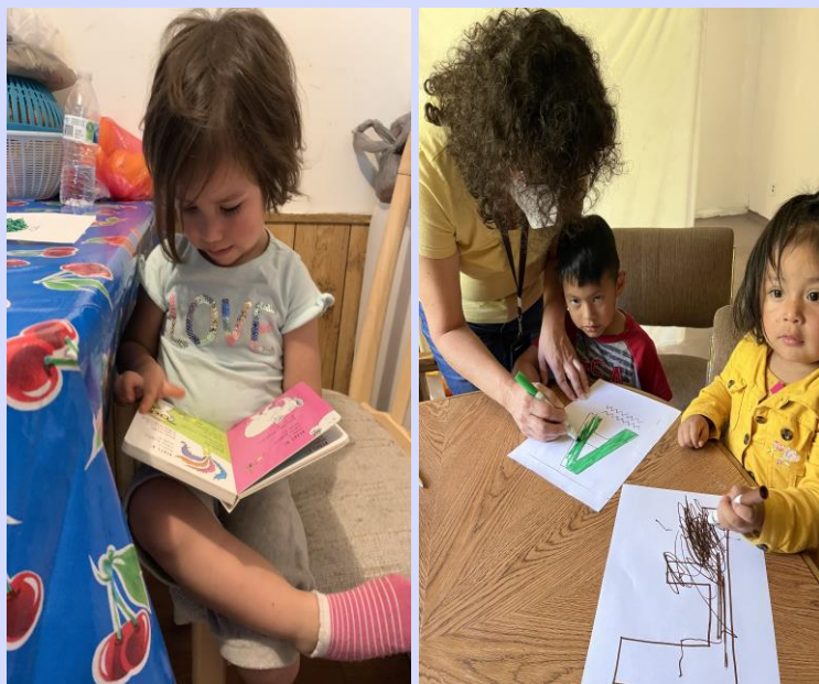
Tutorías en casa con los mas pequeños

116 familias (22%) con niños en los grados K-12 asistieron a diferentes reuniones de participación de padres migrantes donde se discutieron temas como asistencia, actividades de preparación escolar, lectura de boletas de calificaciones, requisitos de graduación de la escuela secundaria, entre otros.