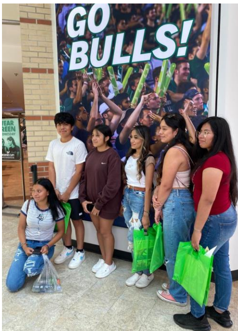
Estudiantes de secundaria en uno de los tours a la Universidad del Sur de la Florida