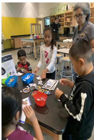
Programa de Verano en el museo Cade

En un esfuerzo por mejorar el rendimiento y abordar la brecha de aprendizaje, el equipo académico trabajó con padres, consejeros y maestros de estudiantes migrantes para establecer sesiones de tutoría para estudiantes con prioridad de servicio (PFS) con necesidades académicas. A lo largo del año, las coordinadoras se mantuvieron en estrecho contacto con los padres para mantenerlos informados sobre los problemas de asistencia, la falta de entrega de tareas por parte de los estudiantes y enseñarles como leer y comprender la boleta de calificaciones. Para los estudiantes de secundaria, la atención también se centró en las calificaciones, el promedio (GPA) y los requisitos de graduación. También se hizo hincapié en involucrar a los padres para que sean participantes activos en la vida académica de los estudiantes. Durante las reuniones de participación de los padres y las visitas domiciliarias, se explicó y discutió este compromiso activo como un aspecto clave del éxito de los estudiantes. Nuestros representantes de MPAC hablaron en estas reuniones trayendo a casa este mensaje que fue bien recibido por los asistentes. Esto fue evidente por las preguntas formuladas y el deseo de aprender más.